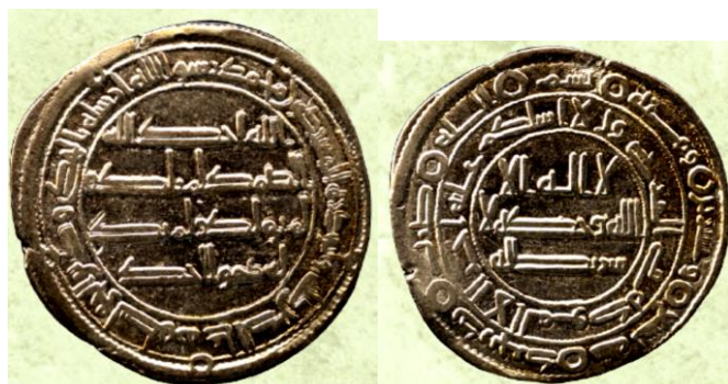
ضرب سنة 129 هـ ضرب دار بجر ( لوح 17 )