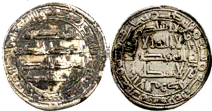
ضرب ماهي سنة 129 هجرية ( لوح 11 )