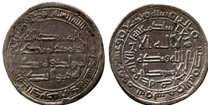
ضرب الري سنة 129 هجرية ( لوح 15 )