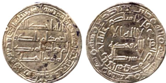
ضرب اصطخر سنة 129 هجرية ( لوح 9 )