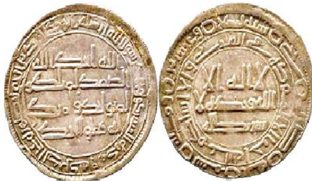
ضرب بجي سنة 129 هجرية ( لوح 4 )