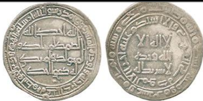
ضرب بمدينة جي سنة 128 هجرية ( لوح شكل 2 )