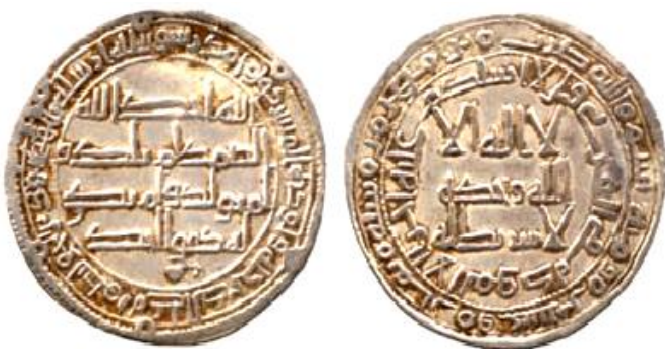
ضرب رامهرمز سنة 128 هجرية ( لوح 7 )