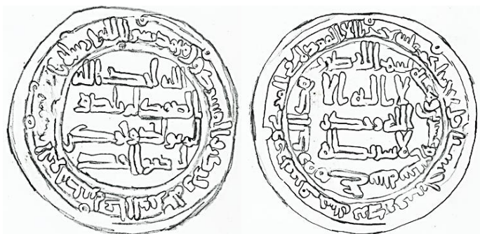
مخطط (1) اول درهم مضروب بجي سنة 127 هجرية رسم الباحث