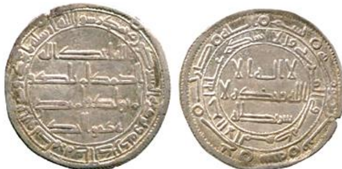
ضرب جي سنة 130 هجرية ( لوح 5 )