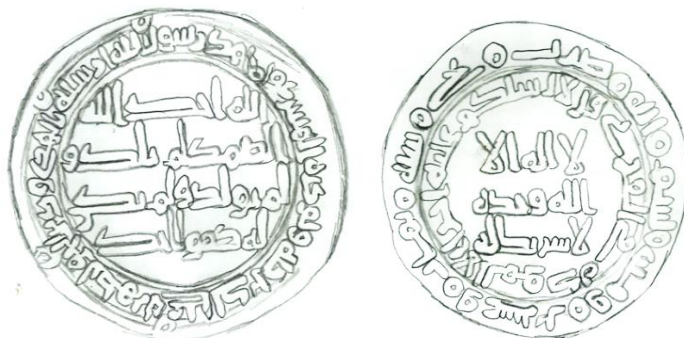
مخطط (2) درهم مضروب في مدينة جي سنة 128 هـ ( رسم الباحث )