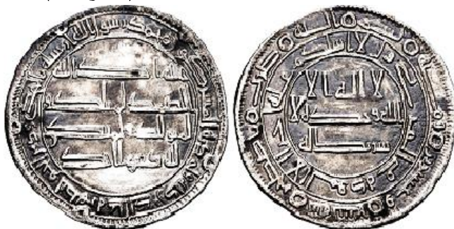
اصطخر سنة 124 هجرية ( لوح 8 )