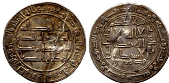
لوح ( 18 ) درهم لابي مسلم الخرساني ضرب مرو سنة 130 هـ