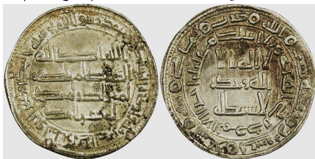
ضرب ماهي سنة 129 هجرية ( لوح 12 )