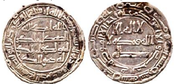
ضرب جي سنة 129 هجرية ( لوح 3 )، كلمة ( بسم O الله ) اعلى قمة نصوص الوجه