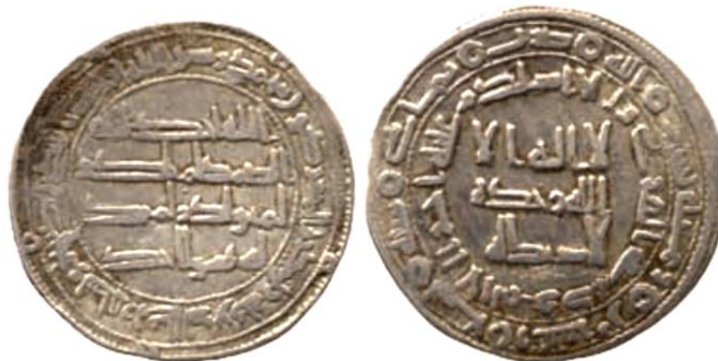
ضرب ماهي سنة 129 هجرية ( لوح 10 )