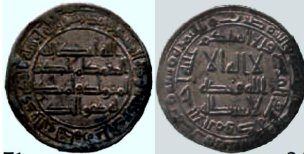
ضرب التيمرة سنة 128 هجرية ( لوح 14 )