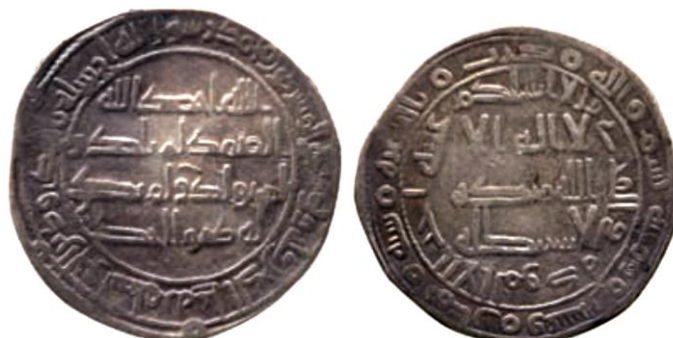
ضرب التيمرة سنة 128 هجرية ( لوح 13 )