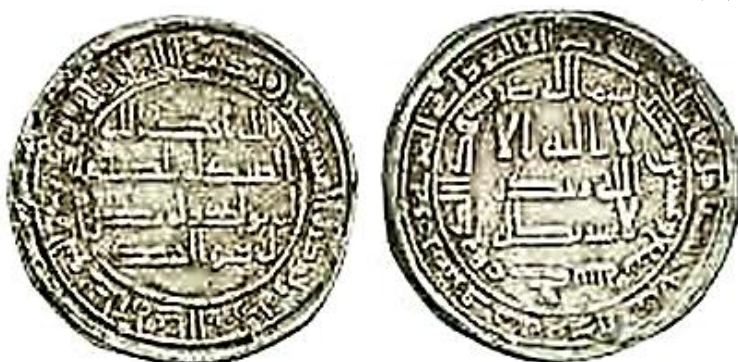
اول درهم ضرب جي 127 هجرية ( لوح شكل 1 )