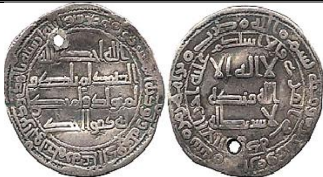
ضرب رامهرمز سنة 128 هجرية ( لوح 6 )