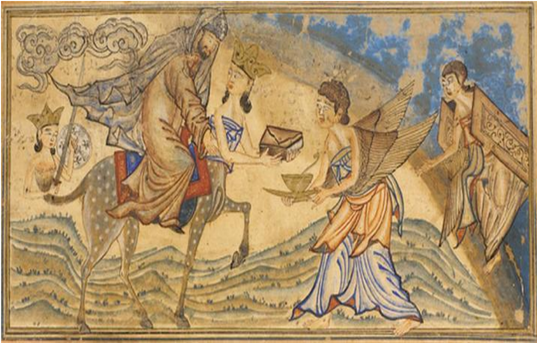
النموذج رقم (١) عروج النبي الاكرم "ص" الى السماء / نسخة مكتبة جامعة ادنبرة / @Louis-GA نقلا عن النت / عرب ٢٠ / ١٣٠٧هـ / م ٧٠٧