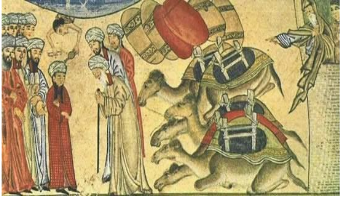
النموذج رقم (٥) لقاء النبي الاكرم "ص" بالراهب بحيرا / نسخة مكتبة جامعة ادنبرة - لندن / ١٣٠٧هـ / ١٣٠٧م / عرب ٢٠