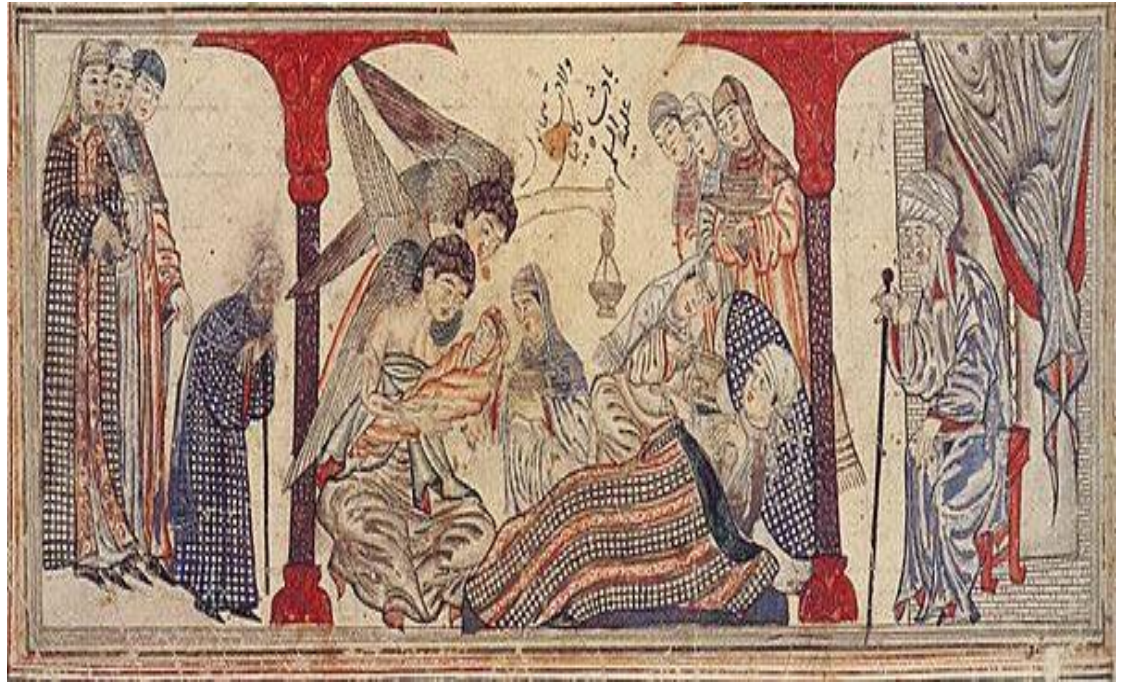
النموذج رقم (٣) ولادة الرسول الاكرم "ص" / نسخة مكتبة جامعة ادنبرة نقلا عن النت ٢٠ / ١٣٠٧م / ٥٧٠٧هـ