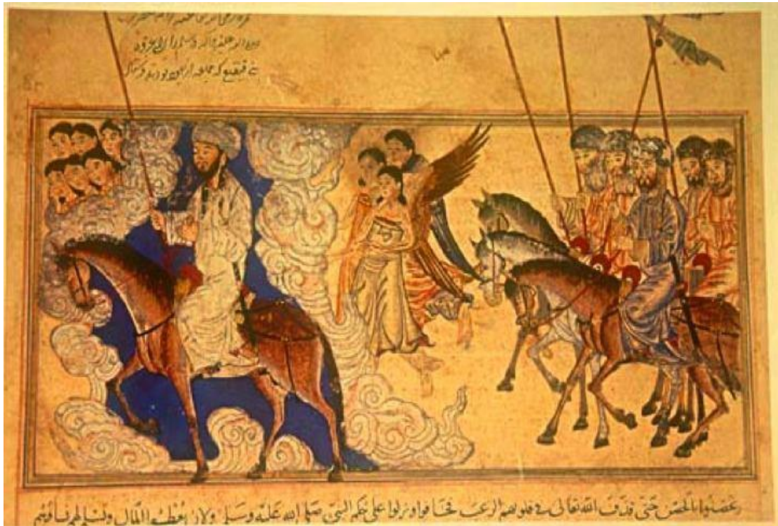
النموذج رقم (٢) غزوة بني قينقاع / نسخة الجمعية الملكية الاسيوية - لندن / @Louis-GA نقلا عن النت / Morley-1 / م ٣١٤هـ / ٧١٤