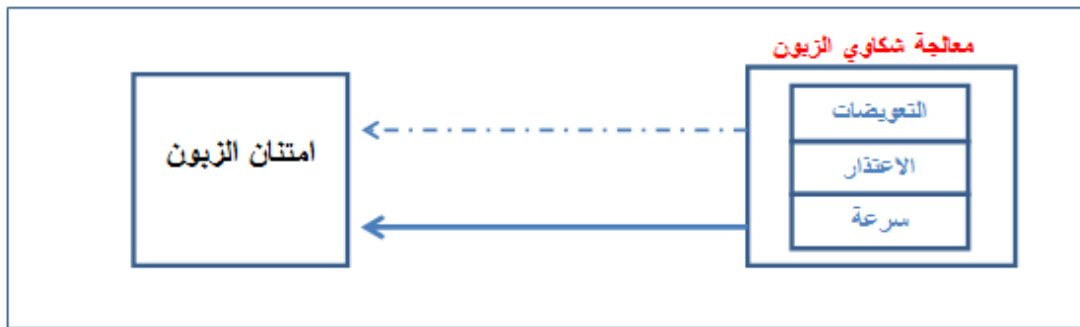
الشكل (١)المخطط الفرضي للدراسة