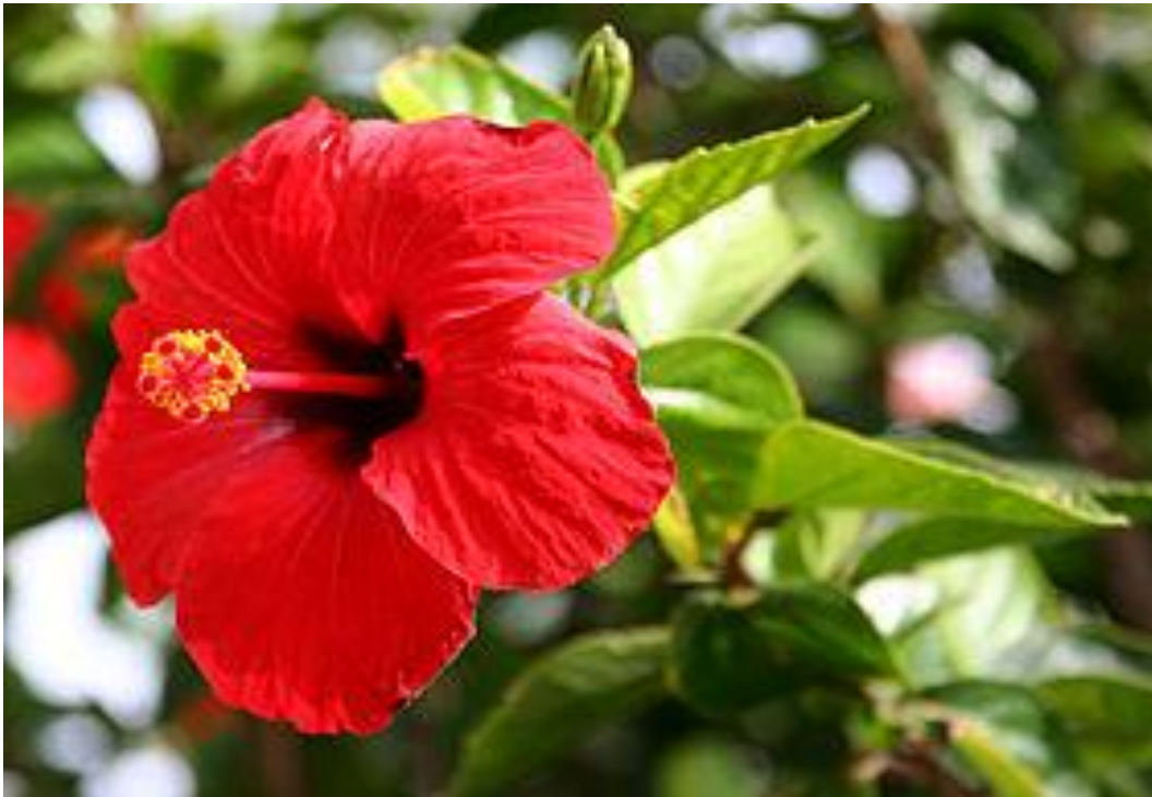
الشكل ( 1 ) لوره الختمه الصيني

نبات من فصيلة الخبازية Malvaceae. شجيرة مستديمة الخضرة يتراوح ارتفاعها بين 2-4 م كثيرة التفرع من القاعدة ، والأوراق كبيرة متبادلة ذات حافة مسننة ، والأزهار بوقية كبيرة حمراء اللون تظهر معظم أيام السنة ، والثمار غير ظاهرة ، والجذور منتشرة ، ومعدل النمو للشجيرة سريع تنمو الشجيرة بشكل جيد تحت الظروف البيئية المحلية ، وتتحمل العوامل البيئية القاسية بشكل متوسط من حيث ارتفاع درجة الحرارة إلى 42 درجة مئوية ولا تتحمل الصقيع ، كما تتحمل بشكل متوسط الجفاف والرياح ، إلا أنها قليلة التحمل للملوحة. [4]