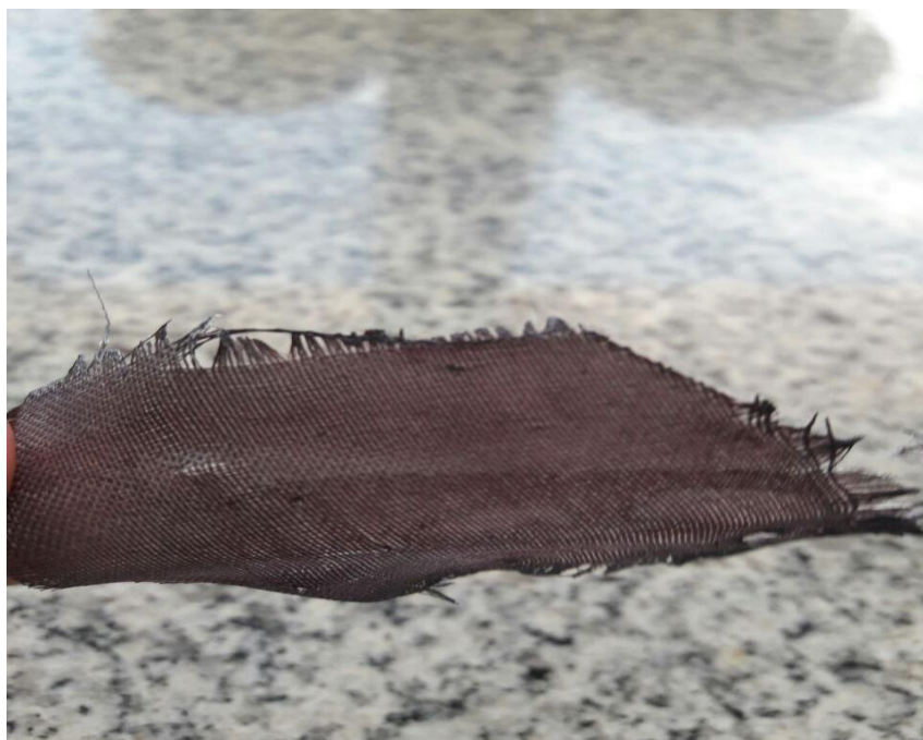
الشكل ( 8 ) لصوره بعد تعرضها للاشعاع

2 - اما بالنسبه الى اختبار ثبوتيه الصبغه باتجاه الاشعاع حيث حدث فيها تغير طفيف