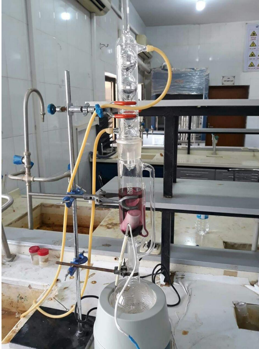
الشكل ( 5 ) لجهاز السكسوليت اثناء العمل