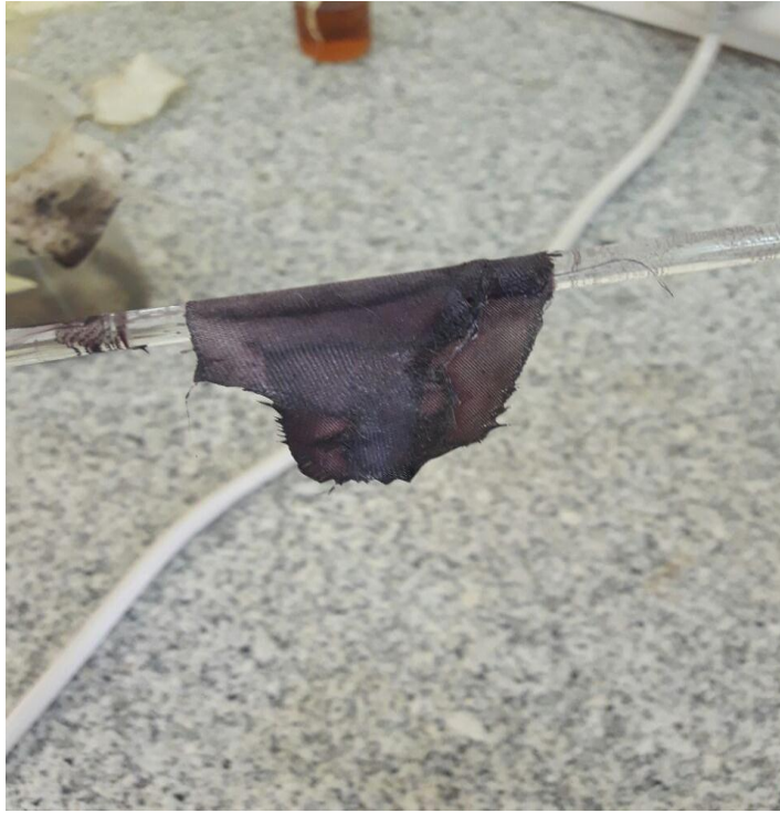
شكل ( 6 ) لقطعة القماش قبل تعرضها لعوامل خارجيه