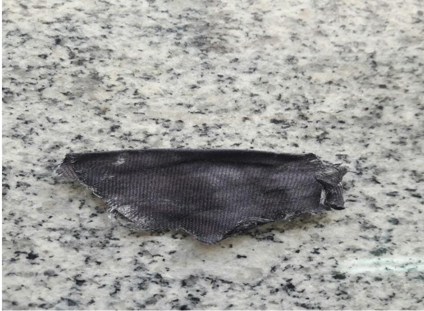
الشكل ( 7 ) لصوره بعد تعرضها الاشعة الشمس