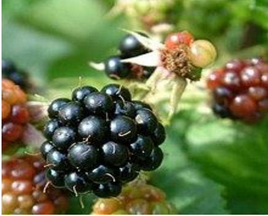
الشكل ( 3 ) صورته تظهر صبغة الانثوسيانات

أطلق "لودفيج ماركارت" الكيميائي الألماني اسم "أنثوكيان" على مركب كيميائي يعطي الأزهار اللون الأزرق ، كان ذلك في عام 1835. وفي عام 1848 تمكن الكيميائي "إف. إس. مورت" فصل مادة "كيانين أو "سيانين" من الأزهار . ونجح "ريتشارد فيلستاتر" التعرف على مادة أنثوسيان في زهرة القمح في عام 1913 . بعد ذلك عرفت مجموعة كاملة من تلك المواد التي تعطي الفاكهة والخضروات لونها الغامق ، مثل الباذنجان والطماطم الزرقاء والتوت والقراصيا والبرقوق. كما لاحظ العلماء أن تبلور أملاح الأوكسونيوم (أملاح فلافونيوم) يكون أسهل من بلورة المادة اللونية المتعادلة شينويد . chinoide .