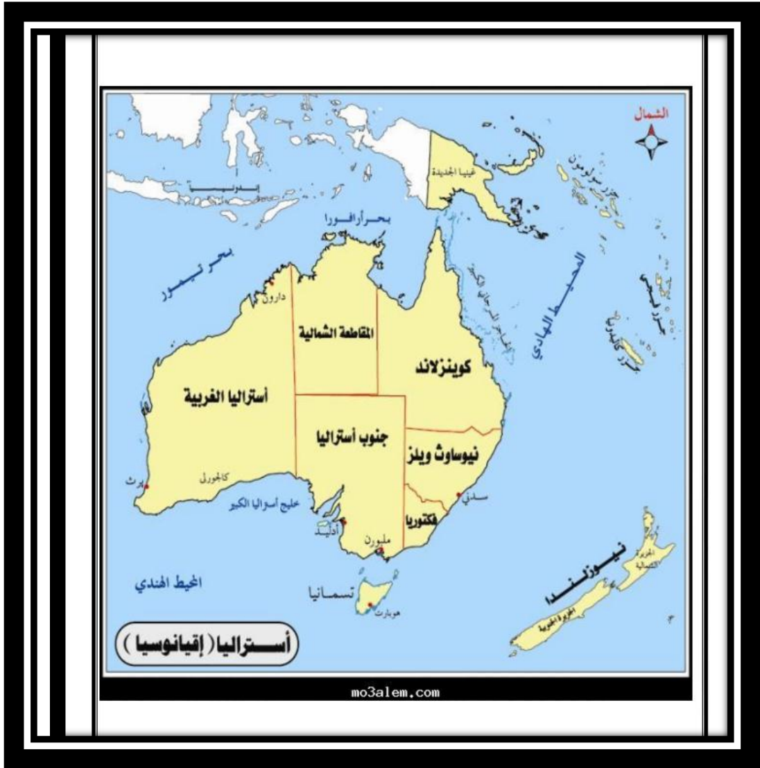
خريطة رقم ٢ جزر المحيط الهادئ