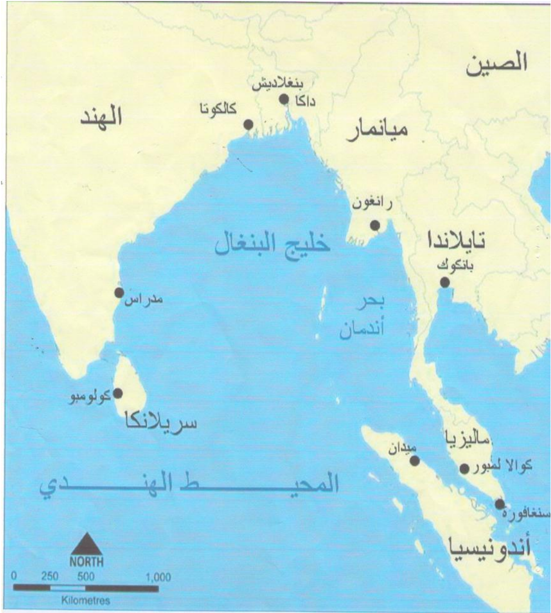
خريطة رقم ٣ جزر المحيط الهندي