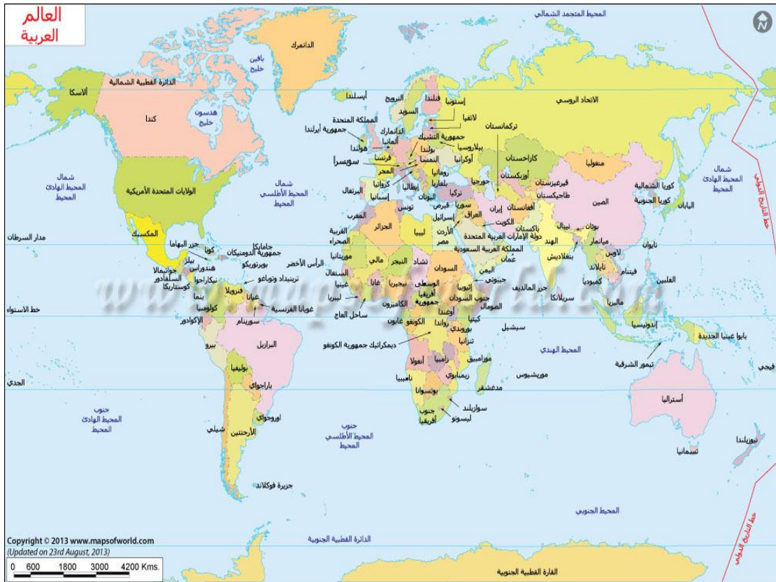
خريطة رقم ١ خريطة توزيع الجزر في العالم