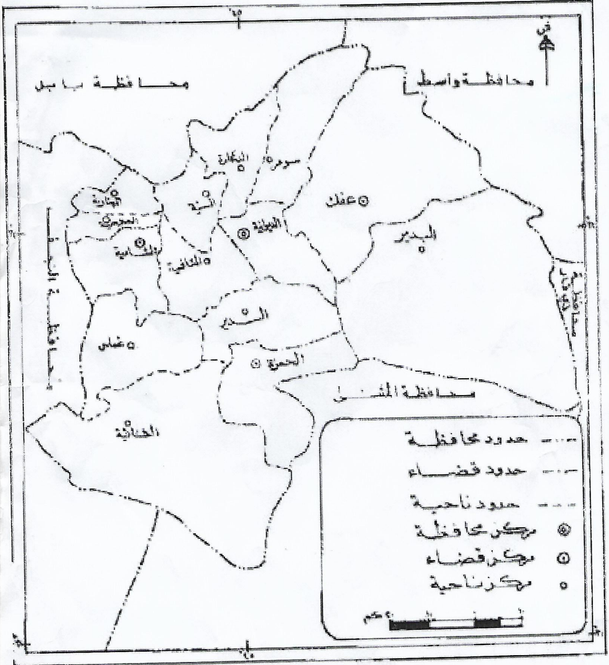
خارطة رقم (١) الوحدات الادارية في قضاء الحمزة