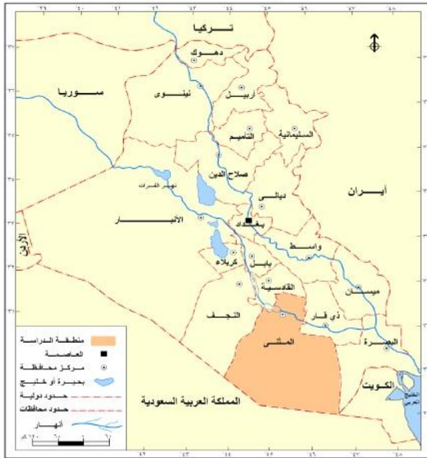
خريطة ( ١ ) موقع محافظة المثنى من العراق

تحدد منطقة الدراسة بمدينة السماوة ، مركز محافظة المثنى التي تمثل الجزء الجنوبي من اقليم الفرات الأوسط الذي يضم فضلا عنها كل من محتفظات كربلاء والنجف وبابل والقادسية . وتمثل مدينة السماوة الواقعة ضمن الحدود البلدية البالغة مساحتها ( ٥٦١٤ ) هكتار .