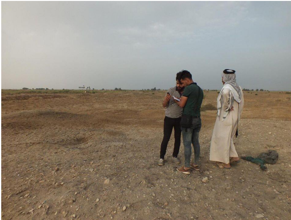
معانية حقلية لموقع الرماحية