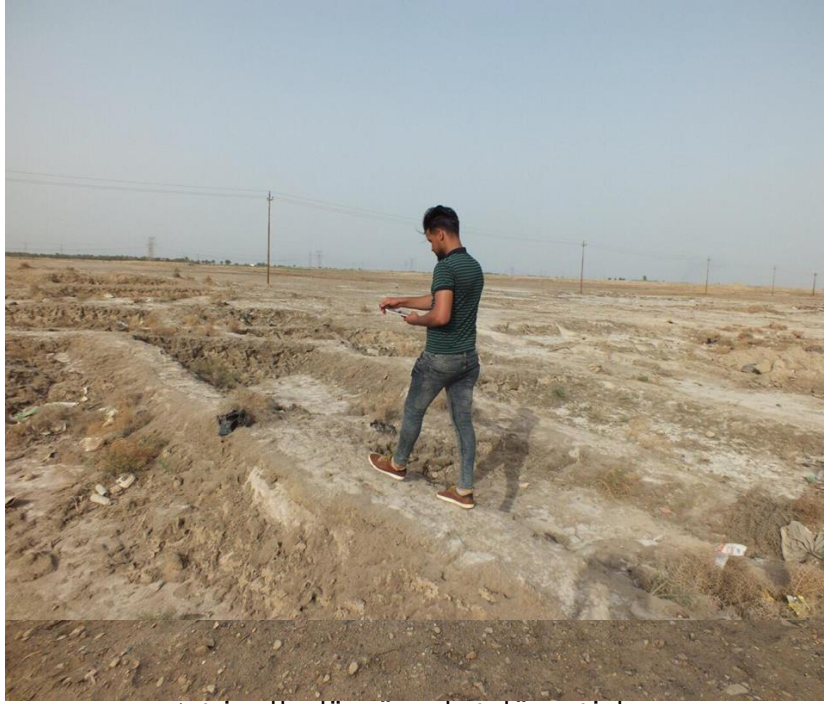
معانيه حقلية لموقع تل المخدة