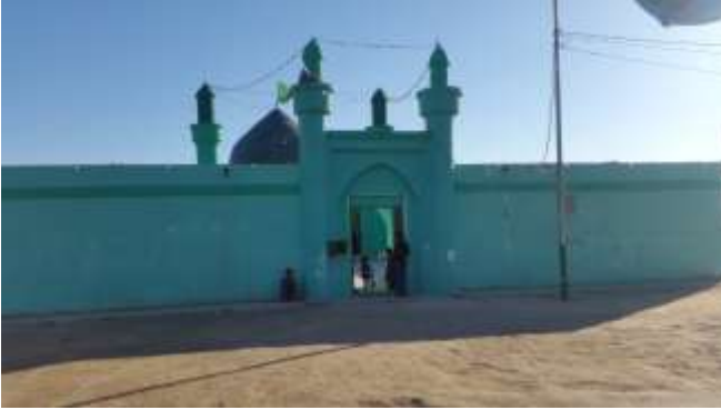
( الشكل ٤ )