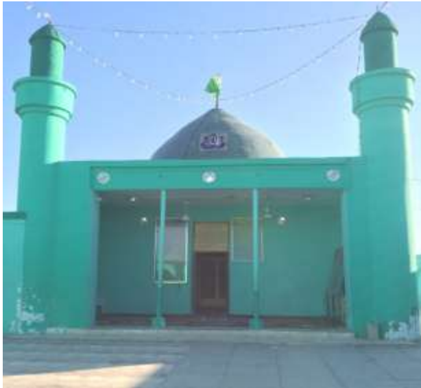
( الشكل ٦ )