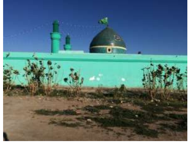
( شکل ۱ - ا. ب )