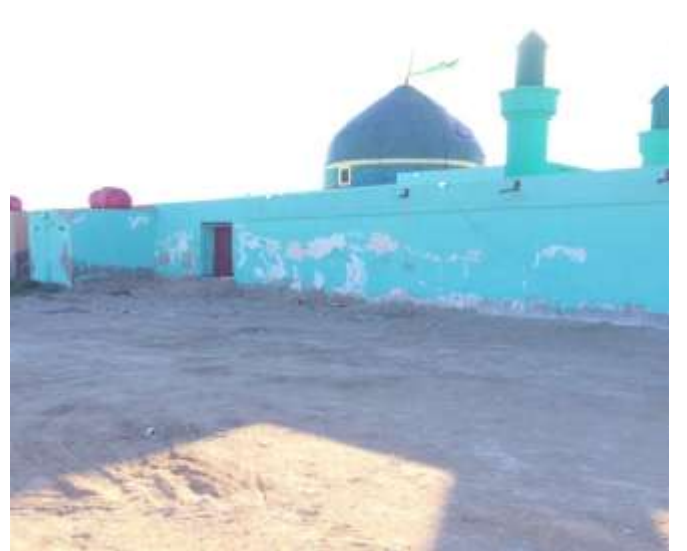
( الشكل ٥ )