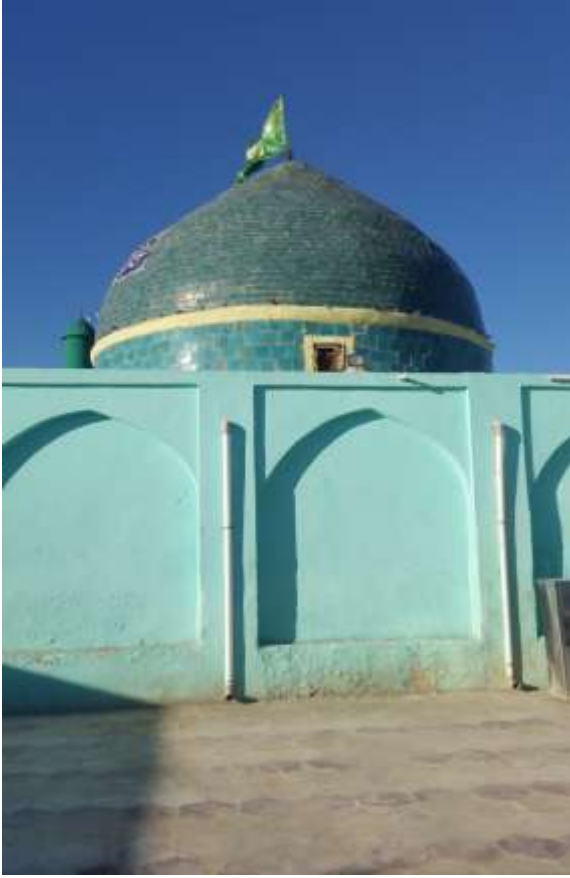
( الشكل ٨ )