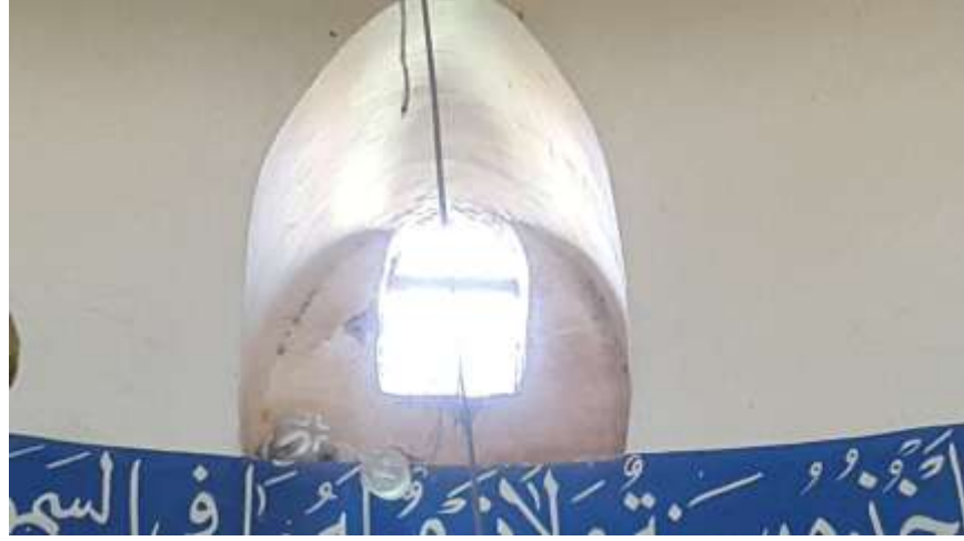
( الشكل ١١ )