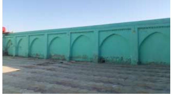
( الشكل ٣ )