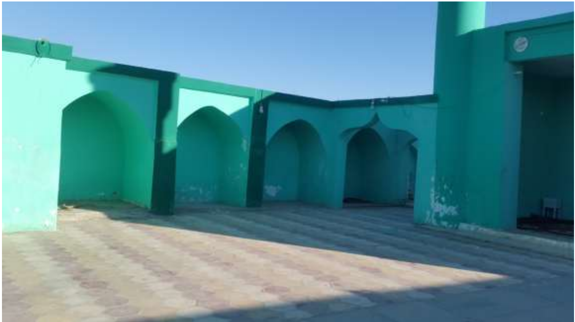
( شکل ۲ )