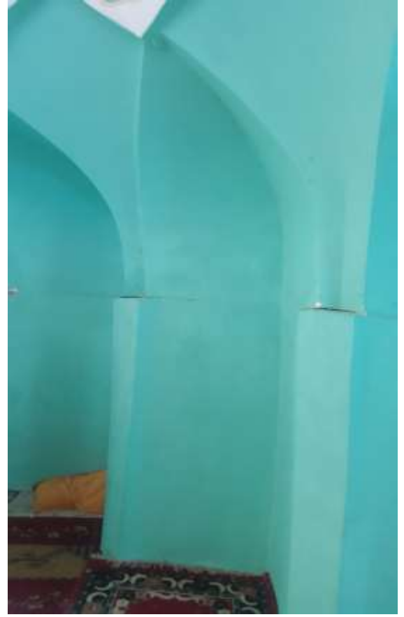
( الشكل ٧ )