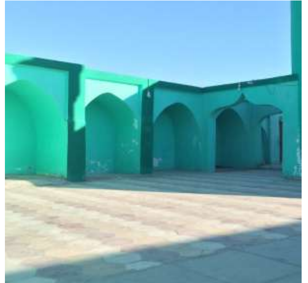
( الشكل ١٢ - أ - ب )