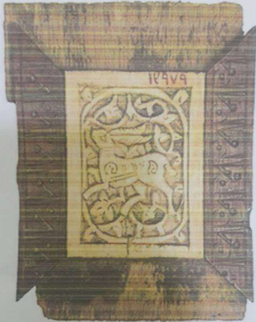
إناء من خشب وقد رسم عليه غزال