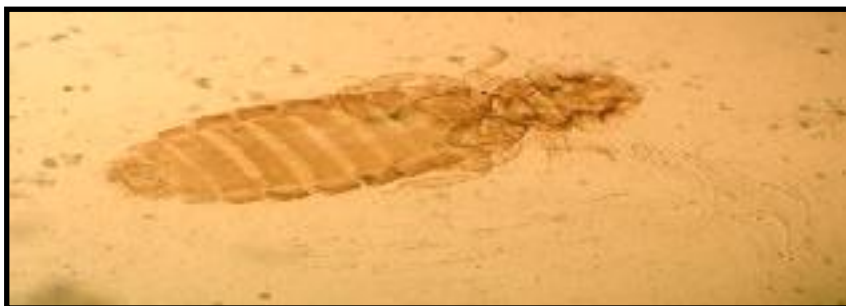
الصورة (5) ذكر القمل العاض Bonomiella columbae (10X).