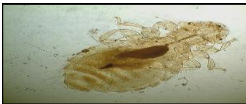
الصورة (1): انثى القمل العوض Menacanthus sp. (10X).