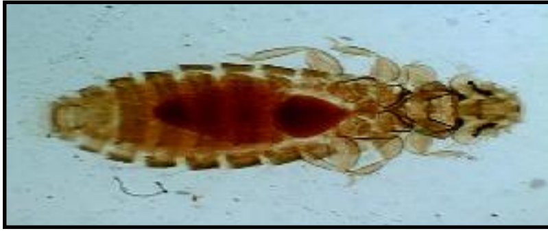
الصورة (2): ذكر القمل العاض Menacanthus sp. (10X)