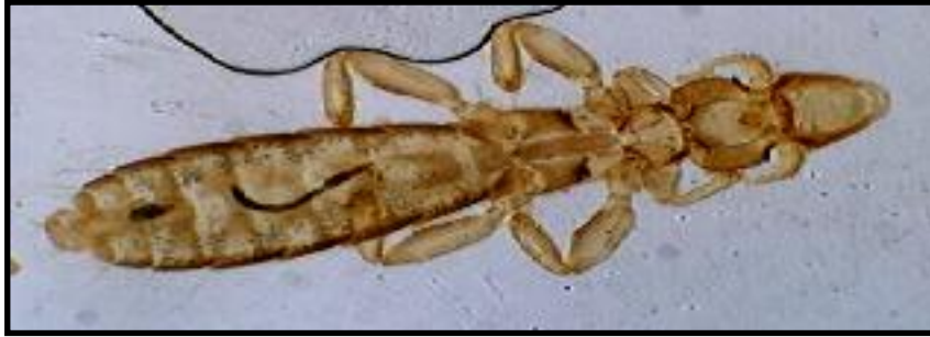
ذكر القمل العاض Columbicola (10X)