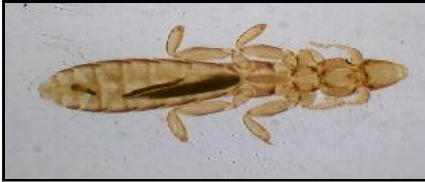
الصورة (4) أنثى القمل العاض Columbicola columbae (10X).