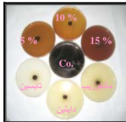
(أ) مستخلص البلوط الكحولي

صورة (١) تأثير المستخلصات المائية و الكحولية للنبات البلوط في النمو الشعاعي للفطر Alternaria alternate