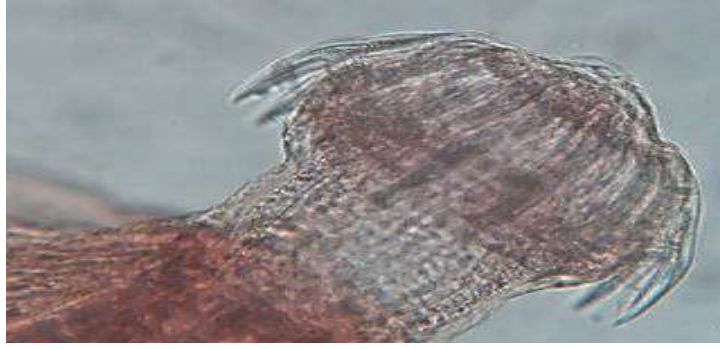
B - صورة مكبرة لمنطقة الرأس (قوة التكبير X 1000).