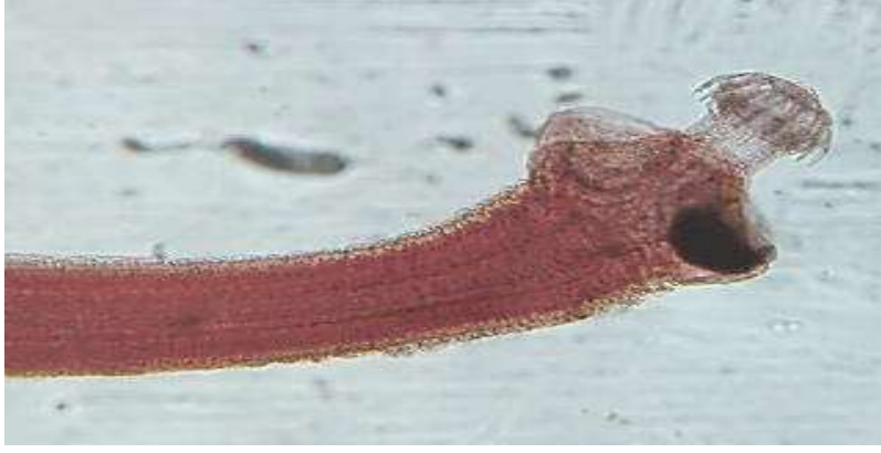
A - منطقة الرأس للدودة الشريطية Hamatolepis teresoides . (قوة التكبير X 400)