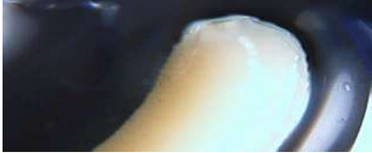
C - النهاية الخلفية. (قوة التكبير X 40)

الشكل (1) : الدودة الشريطية Cloacotaenia megalops