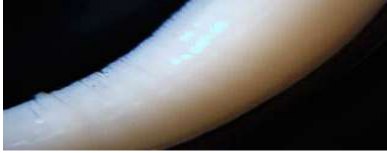
B - القطع الجسمية. (قوة التكبير X 40)