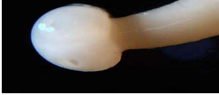
A - الرأس . (قوة التكبير X 40).