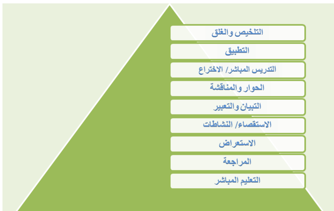
الشكل (4) من اعداد الباحث.

ويشير الباحث الى ان انموذج دانيال (التعليمي المعرفي) يعد مناسباً للمرحلة العمرية التي اختارها الباحث لكون خطوات تحتاج الى قدرات عقلية عليا ك(الاستقصاء، والتعبير، والمناقشة، والاختراع، والتطبيق، والتلخيص) وهذا كله يوفره الجزء العملي من جهة، ومن جهة اخرى عامل الوقت من جهة اخرى حيث يعد تطبيقه بهذه الخطوات بغاية الصعوبة لو كان وقت الدرس (45 دقيقة) بينما في الـ(120 دقيقة) يستطيع المعلم والطلبة المناقشة والحوار والنشاطات والاختراع والتطبيق ولاسيما التلخيص، لذا فان مراحل الانموذج مع طبيعة مادة الكهريائية بجزئها العملي يساعدا الطلبة على دفعهم نحو تفكير علمي افضل وتحصيل اعلى.